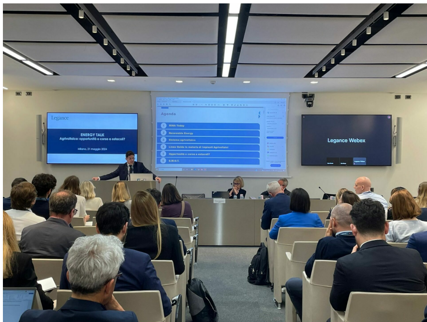
Energy Talk, "Agrivoltaico: opportunità o corsa a ostacoli"

Il 21 maggio, a Milano, si è tenuto l'evento "Agrivoltaico: opportunità o corsa a ostacoli", a cura dello studio legale Legance . L'incontro è stato organizzato nell'ambito degli Energy Talk , una serie di meeting in cui vengono trattati i principali temi legati alla transizione energetica.