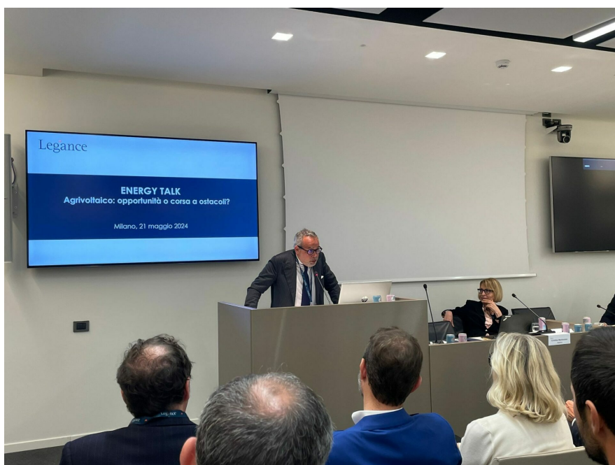
Energy Talk, "Agrivoltaico: opportunità o corsa a ostacoli"